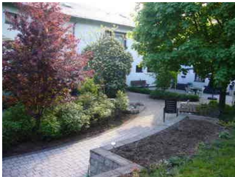
Das Seniorenheim der Elisabeth Stiftung des DRK in Kirschweiler hat die Qualitätsprüfung des MDK mit „Sehr gut“ bestanden“

Die erste Qualitätsprüfung, die der MDK im Oktober 2002 in unserem Haus durchgeführt hat, kam zu einem sehr guten Resultat.